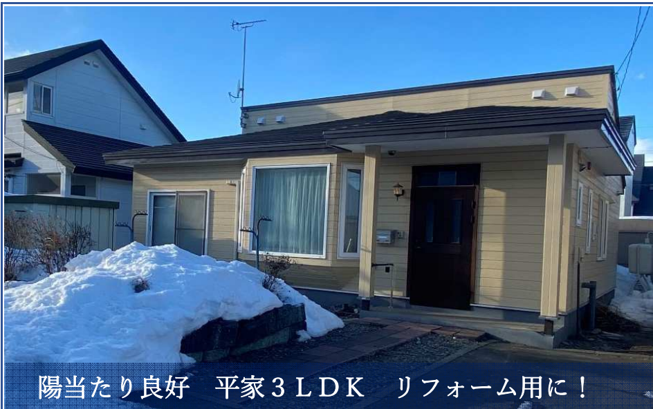
陽当たり良好 平家3LDK リフォーム用に！